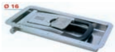
Pommier Furgocar Hi Push låser i moderne avrundet stil.

"HOFSTADS - ET VAREHUS FOR TRANSPORTBRANSJEN"